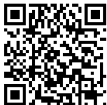
График проведения консультаций: